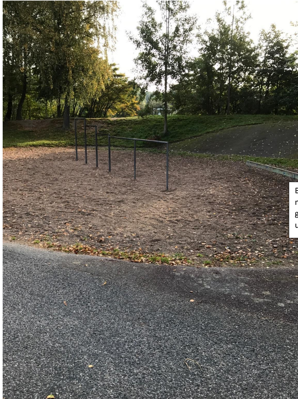
Bild på nuvarande lek område med klängor. Dessa är 40 år gamla och risk finns att de rostade underifrån.