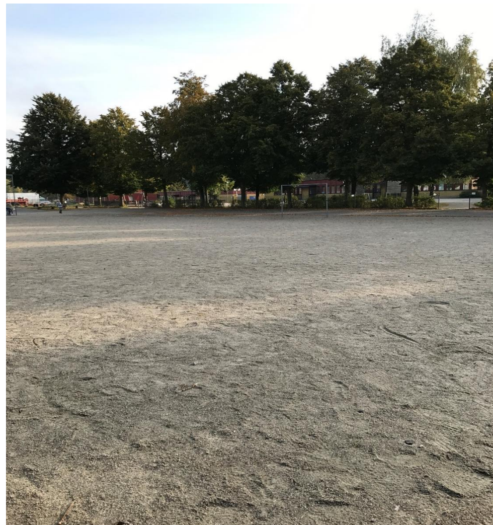
Bilderna visar nuvarande löparbana och grusplan.